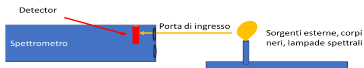
Figura 2: Config. 2 per la caratterizzazione di sorgenti esterne

Le caratteristiche tecniche dichiarate devono essere dimostrate e documentate durante l'installazione e costituiscono parte integrante al fine di conseguire il collaudo positivo.