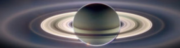
Saturno ed i suoi anelli fotografati in "controluce" dalla sonda Cassini nel 2006

Sono composti da milioni di piccoli oggetti ghiacciati, della grandezza che varia dal micrometro al metro, orbitanti attorno al pianeta sul suo piano equatoriale.